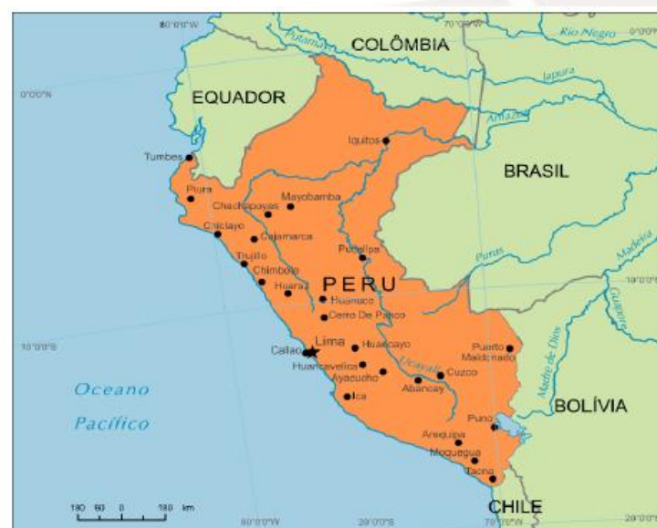
Figura 08 – Peru