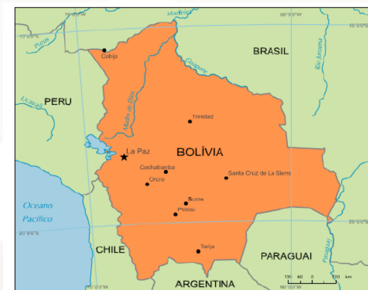
Figura 04 – Bolívia