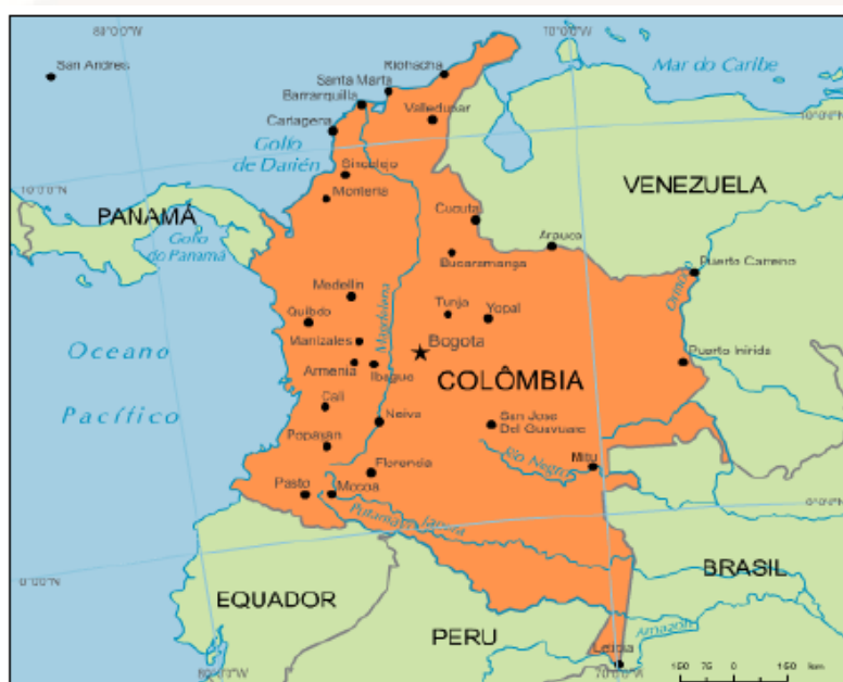
Figura 05 – Colômbia