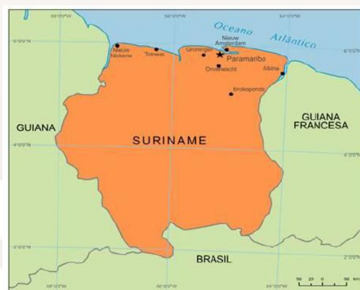
Figura 09 – Suriname