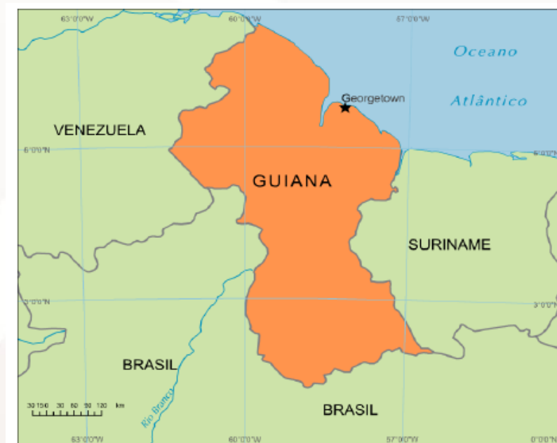
Figura 07 – Guiana