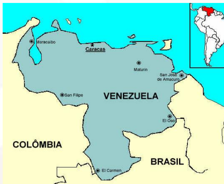
Figura 10 – Venezuela