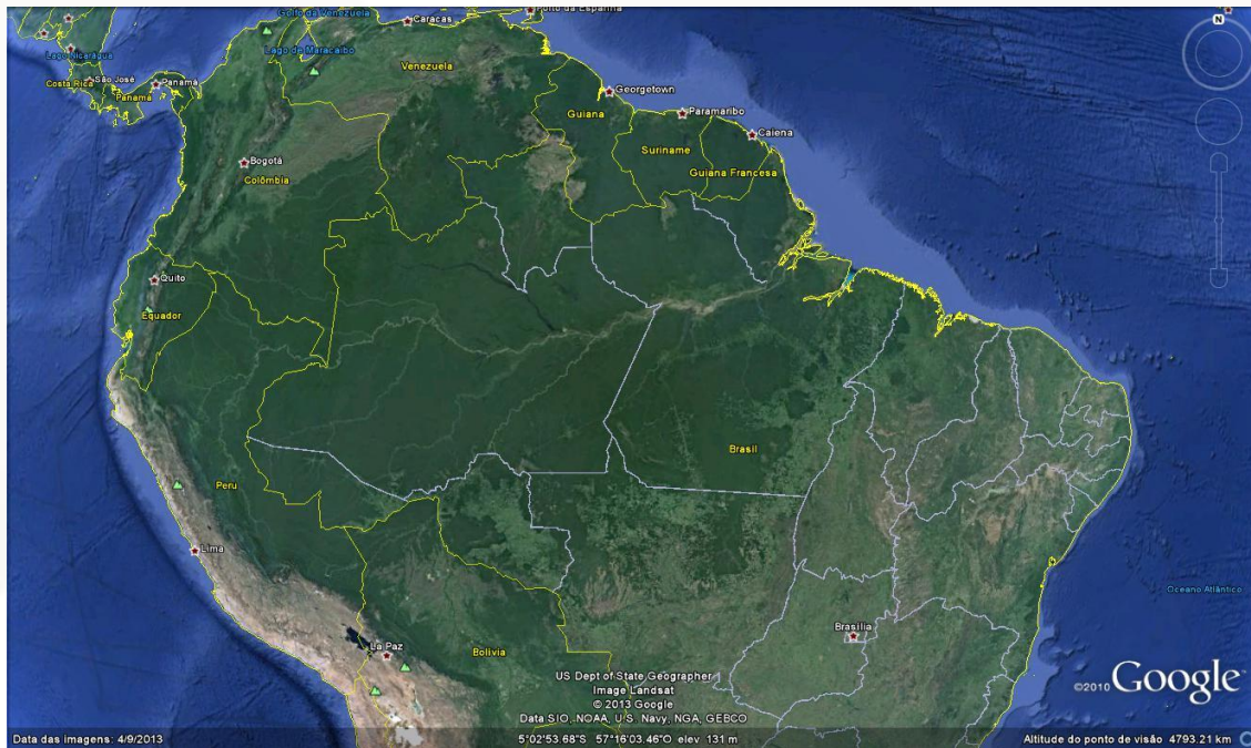
Figura 02 – Países da Pan-Amazônia