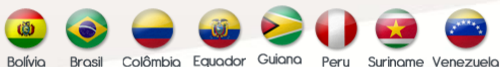
Figura 01 – Ícones representativos das bandeiras dos Países da Pan-Amazônia

A Figura 01 apresenta a representação das bandeiras dos Países da Pan-Amazônia.