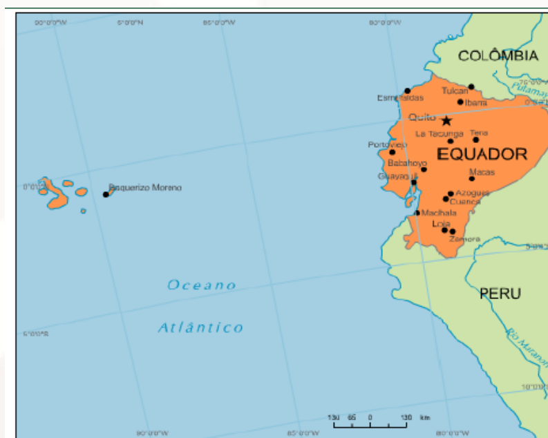
Figura 06 – Equador

Fonte: IBGE – Instituto Brasileiro de Geografia e Estatística